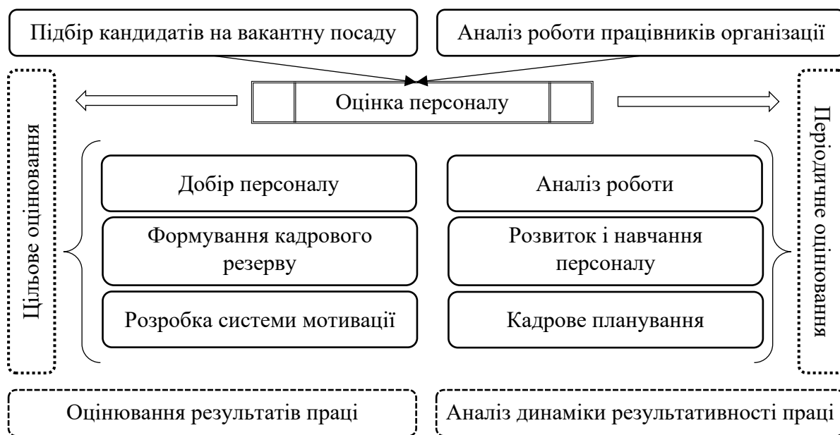
Рис. 1.3. Взаємозв'язок оцінювання працівників з іншими функціями управління персоналом через основні завдання оцінки персоналу